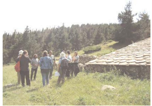
12 juillet à Font fréda: journée sur le pastoralisme

* Le C.N.P.N., ou Conseil National de la Protection de la Nature, est l'organisme qui étudie tous les plans de gestion des Réserves Naturelles de France, afin d'apporter leurs corrections et de les valider. Il compte en son sein de nombreux spécialistes reconnus.