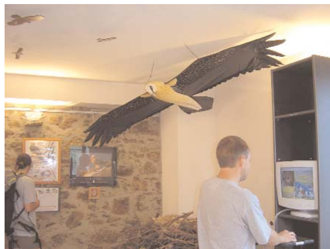
Le CD-rom comprend deux parties. La première partie est consacrée à la connaissance "du personnage".