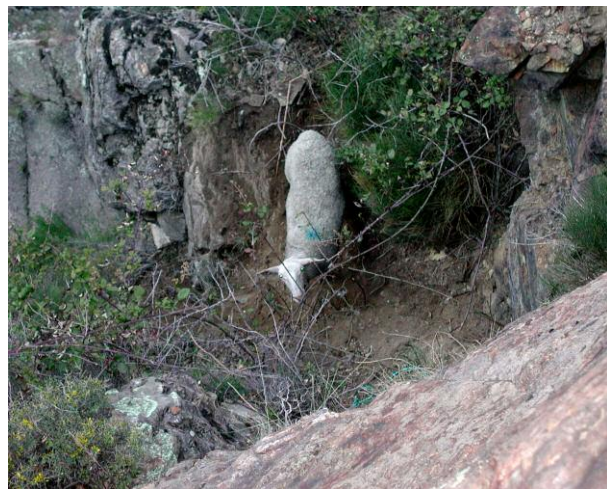
La rescapée des gorges de Nyer