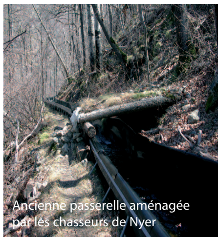
Ancienne passerelle aménagée par les chasseurs de Nyer