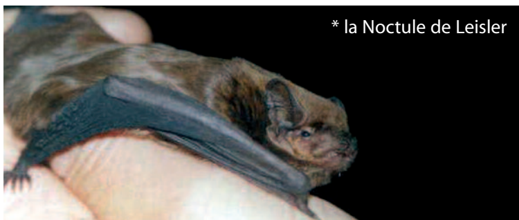
* la Noctule de Leisler

Sur le territoire de la Réserve de Nyer, la présence de la Noctule de Leisler a été mise en évidence en 2002 lors du premier inventaire chiroptérologique du site. Elle a en effet été contactée dans les gorges de Nyer et dans les forêts de l'étage montagnard.