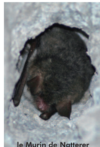
le Murin de Natterer