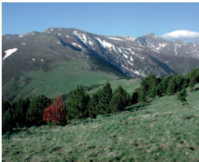
Zone d'estive des troupeaux ovins au printemps