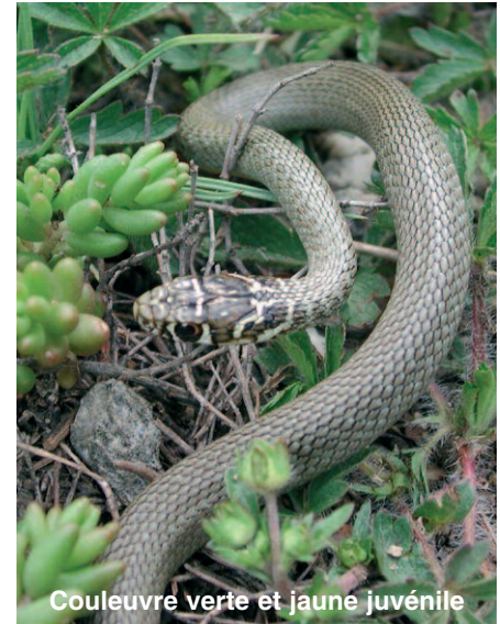
Couleuvre verte et jaune juvénile