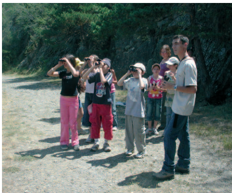
Les enfants scrutent le ciel ...

Par l'apprentissage ludique, l'objectif est de faire adopter à ces enfants des comportements respectueux de la nature.