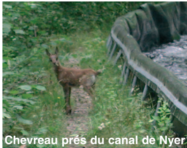
Chevreau près du canal de Nyer

Dans le détail, il semble que les localisations des individus aient évolué. C'est ce qui est à l'origine des faibles observations réalisées au printemps. Les isards fréquente-